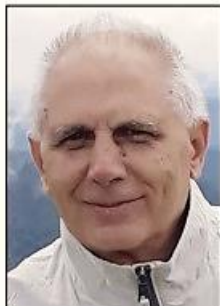
IOAN N. ROȘCA - Premiul pentru întreaga activitate filosofică